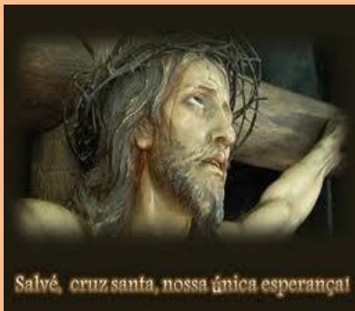
sexta-feira santa (dia de jejum e de abstinência)

Adoração ao Santíssimo Sacramento na Igreja da Nossa Senhora da Conceição, até às 24 h