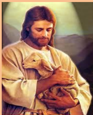
DOMINGO DE PÁSCOA